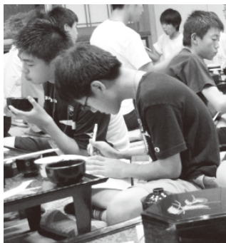
朝食中も「朝イチバトル」(テスト)準備