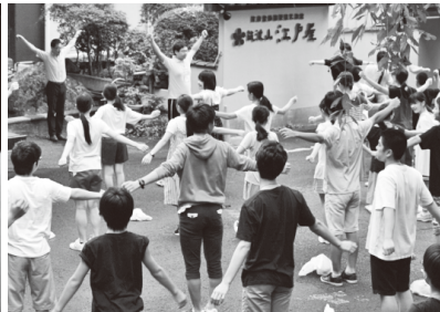
朝は当然ラジオ体操